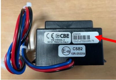
CSB2 Teilnumber (AL-KO VTE)