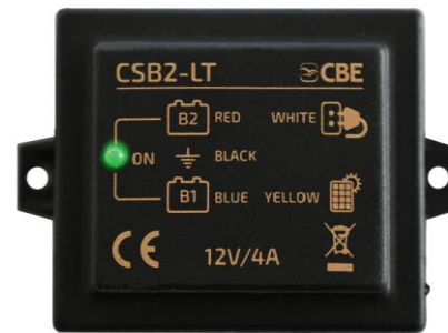
CSB2-LT p/n 205026