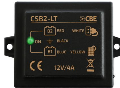
CSB2-LT nº peça 205026