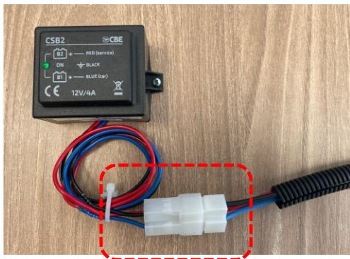
CSB2 nº peça 205025 / GR5025