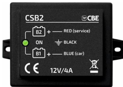
CSB2 nº peça 205025 / GR5025