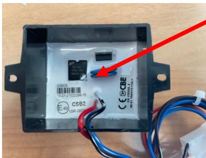
CSB2 part number (AL-KO VTE)