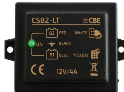
CSB2-LT p/n 205026